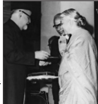
ಮಾರ್ಚ್ 12, 1968ರಲ್ಲಿ ಜಾಕೀರ್ ಹುಸೇನ್ ಅವರಿಂದ 'ಪ್ರಾಣಮಿತ್ರ' ಪ್ರಶಸ್ತಿ

ಇದಕ್ಕೆ ವೈರುಧ್ಯವೆಂಬಂತೆ ಇವತ್ತಿಗೆ ಅವರು ಸುಧಾರಣೆ ತಂದ ಕಲೆಯನ್ನು ಕಲೆಯೇ ಅಲ್ಲ ಎಂದು ಹೇಳುವವರಿದ್ದಾರೆ. ಆದರೆ ಯಾವುದಕ್ಕೆ ಅರ್ಥವಿಲ್ಲವೋ, ಪೊಳ್ಳೋ - ಅದನ್ನು ನಂಬಲು ನಿರಾಕರಿಸುತ್ತಿದ್ದ, ಅಂಥವಾಗಿ ಒಪ್ಪುವುದಕ್ಕೆ ವಿರೋಧವಿದ್ದ, ಮೂಢನಂಬಿಕೆಗಳನ್ನು ಕಡೆಗಣಿಸುತ್ತಿದ್ದ ಅವರ ಮುಂದಿನ ತಲೆಮಾರು ಅವರಿದ್ದಂತೆಯಿಲ್ಲ. ಹಾಗಾಗಿ ಇಂದಿನ ಭರತನಾಟ್ಯದ ಅಭಿವ್ಯಕ್ತಿಯನ್ನು ನೋಡಿಕೊಂಡು ರುಕ್ಕಿಣಿ ಅವರ ಪ್ರಯತ್ನಗಳನ್ನು ಹೀಗೆಳೆಯುವುದು ಸಭ್ಯತೆಯಲ್ಲ.