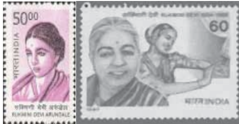
ಭಾರತ ಸರ್ಕಾರದಿಂದ ರುಕ್ಕಿಣಿದೇವಿ ಸ್ಮರಣಾರ್ಥ ಬಂದ ಅಂಚೆಚೀಟಿಗಳು

ಕಲೆಯಲ್ಲಿ ಅವರು ತಂದ ಮಾರ್ಪಾಡುಗಳೂ ಕ್ರಾಂತಿ. ಆದರೆ 'ಗಿಣಿಪಾಠ'ಕ್ಕೆ ಪ್ರಾಶಸ್ತ್ಯ ನೀಡುವುದು ಅವರ ಜಾಯಮಾನಕ್ಕೆ ಬಂದಿರಲಿಲ್ಲ. ಬ್ಯಾಲೆ, ಕಥಕಳಿಯ ಸಂಪರ್ಕದಲ್ಲಿ ತಮ್ಮ ಕಲ್ಪನೆಗೆ ನಿಲುಕಿದ ಸಂಗತಿಗಳನ್ನು ಅಚ್ಚುಕಟ್ಟಾಗಿ ನಿರೂಪಿಸಿದರು. ಅದನು ಪರಂಪರೆ ಎಂಬ ಹೆಸರಿನಲ್ಲಿ ಸೋಗುಹಾಕದೆ ತಮ್ಮ ಅಭಿವ್ಯಕ್ತಿಯ ರೂಪಕ್ಕೆ ಇತ್ತ ನೂತನ ಸ್ಪರ್ಶವೆಂಬಂತೆ ಕಂಡರು. ಕಲೆಯ ವಿಸ್ತಾರವನ್ನು ಉಳಿಸುವುದು ಅವರ ಕಾಯಕವಾಗಿತ್ತೇ ವಿನಾ ಅನುಕರಣೆಯ ಉದ್ದೇಶ ಅವರಿಗಿರಲಿಲ್ಲ.